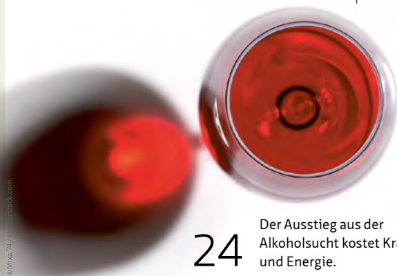
24 Der Ausstieg aus der Alkoholsucht kostet Kraft und Energie.