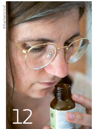
12 Wie riecht die Freiheit? Über Umwege und Momente des Scheiterns zur persönlichen Vision eines guten Lebens.