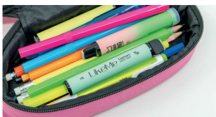
Leuchtstift oder Vape?